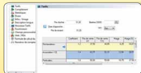
Gérez jusqu'à 5 tarifs différents

Rythmez votre activité commerciale en fonction des saisons et des événements. Mettez en place des opérations ciblées et déterminez une date de début et une date de fin d'opération.