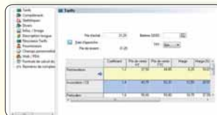
Gérez jusqu'à 5 tarifs différents

Rythmez votre activité commerciale en fonction des saisons et des événements. Mettez en place des opérations ciblées et déterminez une date de début et une date de fin d'opération.