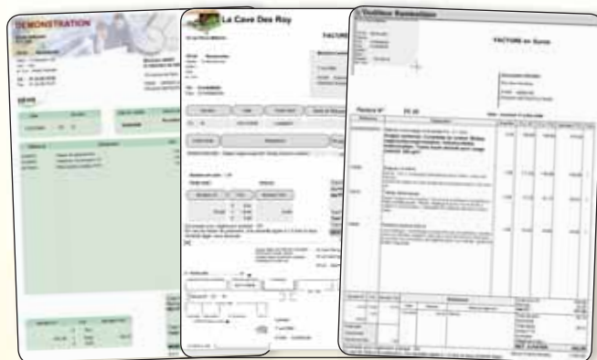
Personnalisez vos pièces de vente aux couleurs de votre entreprise (logo, images...)

Présentez à vos clients des documents professionnels à l'aide de nombreux modèles prêts à l'emploi. Puis d'un simple clic, envoyez-les par e-mail.